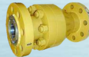
Düsen-Rückschlagventile Nozzle Check Valves

Types: KDG-T, AKF-T, KDT-RBS DN: 200-2000 (8"-80") PN: 6-40 (class 125-300) Temp: 0° → +80°