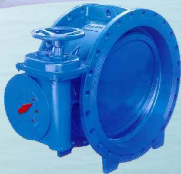
Flansch-Absperrklappen Flanged Butterfly Valves

Types: KD-G, AKF, AKF-M3 DN: 100-2500 (4"-100") PN: 6-40 (class 125-300) Temp: -20° → +400°