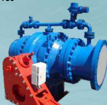
Zentrische Kugelhähne Offset Flanged Ball Valves

Types: KKGH DN: 50-600 (2"-24") PN: 6-100 (class 125-600) Temp: 0° → +300°