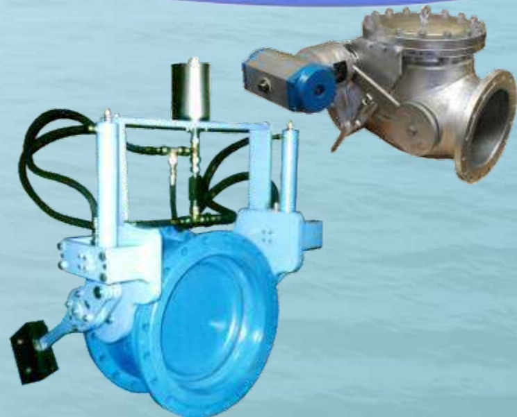
Flansch-Rückschlagklappen Swing & Tilting Check Valves

Types: KD-G, AKF, AKF-M3 DN: 100-2500 (4"-100") PN: 6-40 (class 125-300) Temp: -20° → +400°