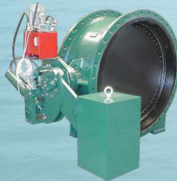
Turbineneinlauf-Klappen & Rohrbruch-Klappen Turbine inlet & Pipe Burst Valves

Types: 8RA, 8RB, 8RK, 8RK-M, 8RK-E DN: 100-1400 (4"-56") PN: 6-100 (class 125-600) Temp: 0° → +350°