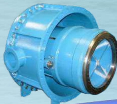
Kegelstrahl-Schieber Hollow Jet Cone Valves

Types: KGS DN: 500-1000 (20"-40") PN: 6-25 (class 125-150) Temp: 0° → +80°